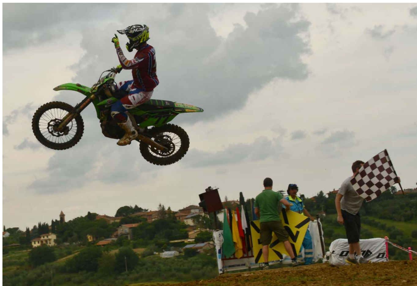
—tras 2018 camp it prestige partenza.jpg