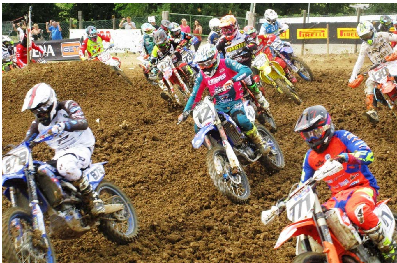
—tras 2018 camp it prestige podio mx1.JPG