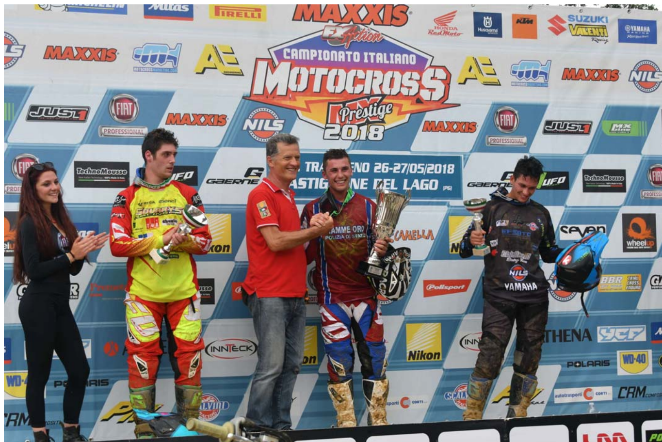
— tras 2018 camp it prestige salto gruppo.JPG